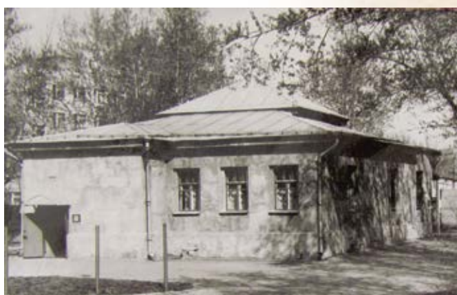
Долгое время, вплоть до 1991 г., основным было здание морга (бывшей часовни). Здесь функционировали администрация, морг, амбулатория, а позже и гистологическое отделение