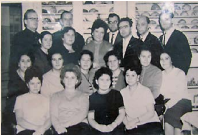
Сотрудники бюро судебно-медицинской экспертизы и кафедры судебной медицины. 1967